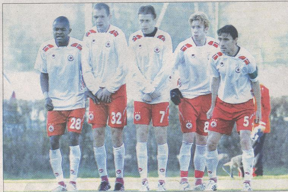
"Армейците" от терена и трибуните ще трябва да се борят за възвръщането на великия червен отбор, което ще се случи въпреки всичко

Така постепенно достигам до извода, че ЦСКА може да бъде стабилизирани и от българин/българска компания.